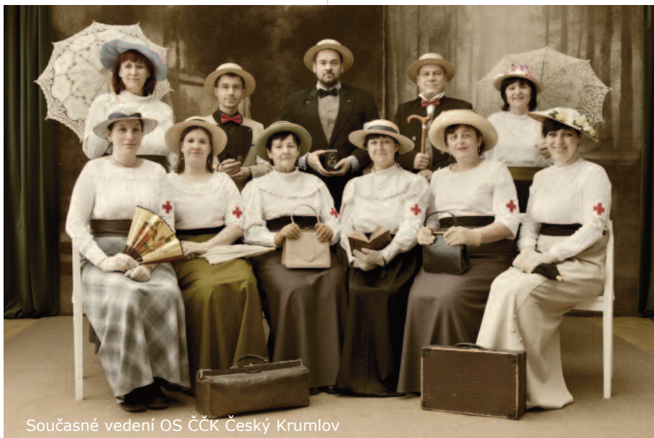
Současné vedení OS ČČK Český Krumlov

Bližší informace nejenom o naší činnosti získáte na stránkách www.cckck.cz