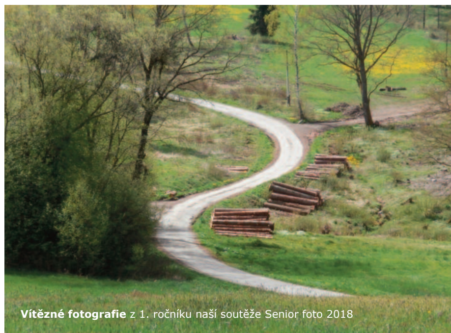
Vítězné fotografie z 1. ročníku naší soutěže Senior foto 2018

Děkujeme tímto všem členům HYALITU za finanční dar, zejména však za toto krásné gesto solidarity. Vážíme si aktivity členů spolku, kterou dokázali přenést k pomoci lidem se zdravotním postižením. Toto gesto je ukázkou zdravého fungování uvnitř místní komunity a zaslouží si obdiv a respekt.