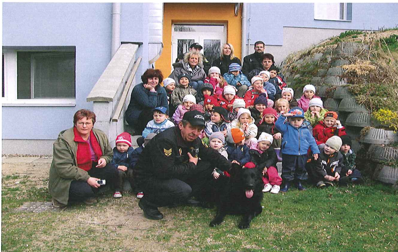
Fotografie z provedené preventivní besedy v MŠ v obci Malonty