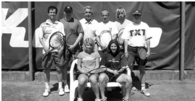
Tenis divize – Sokol Kaplice 2005