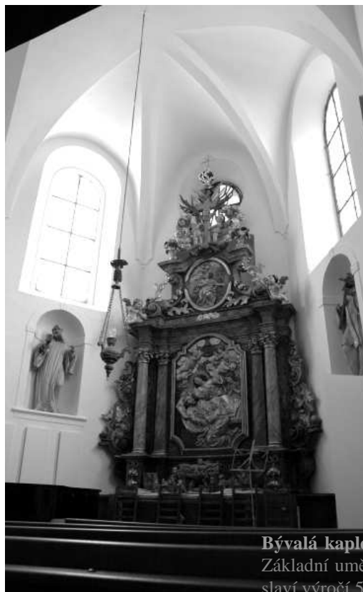
Bývalá kaple sv. Josefa a sv. Barbory. Část Základní umělecké školy v Kaplici, která letos slaví výročí 50 let od svého založení ...

Rozpis svozu tříděného odpadu najdete na str. 9