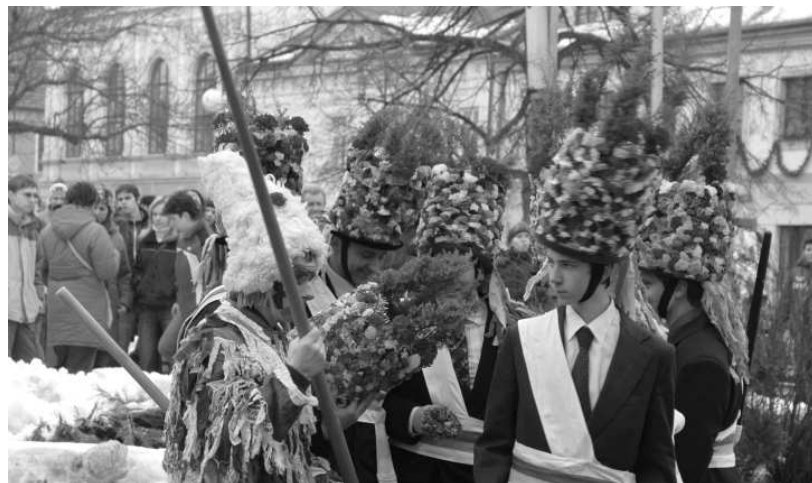
Staročeská koleda v Kaplici. Zvláštní poděkování patří koledníkům, a také učňům (Gymnáziu, SOŠE A SOU Kaplice), kteří se postarali o občerstvení ...

Ještě bychom chtěli upozornit na naše dobře fungující pobočky knihovny. Na Sídlíšti 9. května v panelové domě č. 776 je pobočka otevřena ve čtvrtek od 14.00 do 18.00 hodin. Pobočka v Blansku pak v úterý mezi 16.30 a 19.30 hodinou. Všechny čtenáře i příznivce knihovny srdečně zveme.