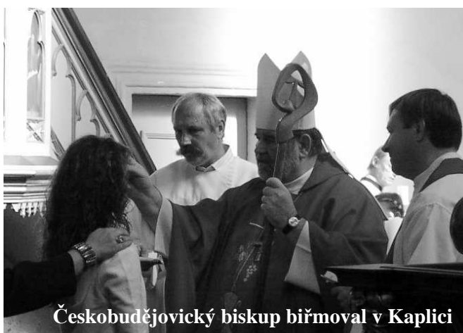
Českokobudějovický biskup biřmoval v Kaplici

Na prosinec v Kině Kaplice připravujeme: MRAVENČÍ POJIŠŤOVNA /4. 12./ HADI V LETADLE, SILENT HILL, HEZKÉ CHVILKY BEZ ZÁRUKY