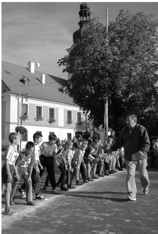
Foto: 20. září 2007, na startu Večerního běhu

První týden v říjnu zahajujeme pravidelnou činnost kroužků, jazykových kurzů, Jógy pro denní život...