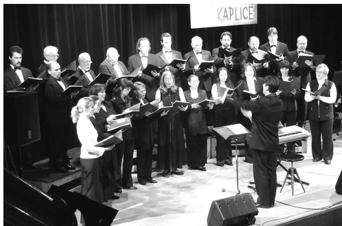
Tříkrálový koncert v Kaplici, Foto: Jihočeský kurýr

1) Vlastník kulturní památky je vždy povinen předem žádat o vydání závazného stanoviska oddělení památkové péče MěÚ Kaplice při jakékoli zamýšlené údržbě, opravě, rekonstrukci, restaurování nebo jiném stavebním zásahu vně i uvnitř nemovitosti .