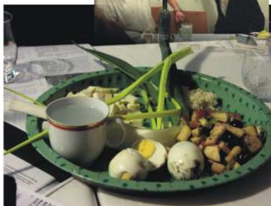
Foto: Sederová mísa se symbolickými pokrmy a mrskáni souseďů pörkem...