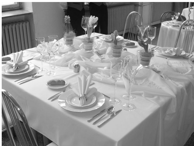
Na smílu ukázka soutěžního stolování z oboru číšník