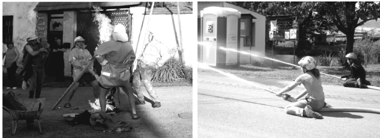
Dobrovolní hasiči slavili ve Žďáru 650. výročí osady...