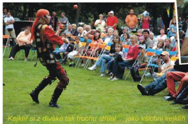
Kejkliř si z diváků tak trochu střílel... jako všichni kejkliři