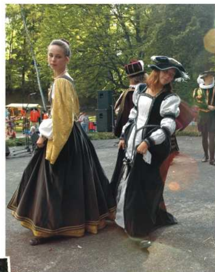
Renesanční tanec ozdobil podvečer