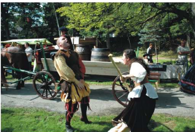
... stává se v zeleni se koupající městský park dějištěm příchodu družiny pána z Pořešína, ale také nelitostného přepadení formanského povozu loupežníky. Mezi lapky a formankami, převážejícími sůl po stezce, se rozpoutá krátká bitka...