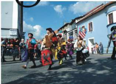
Jednoho sluncem zalitého srpnového doledne roku 2008...