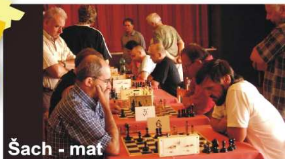
Šach - mat

V obou odděleních knihovny a na pobočkách zápisné na jeden rok zdarma pro nové čtenáře, každoroční čtenářská amnestie, tj. prominutí poplatků za upomínky a také Internet zdarma pro zájemce na 30 minut. V oddělení pro děti proběhne soutěž " Karel Čapek " - křížovka. V oddělení pro dospělé budou k nahlédnutí všechny kroniky knihovny. Pobočka Blansko připravila na 7. října soutěžní odpoledne pro celou rodinu " Přijďte pobýt do knihovny ".