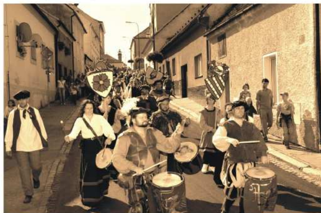
Okamžik, kdy se formaci bubeníků uličkami města vedený historický průvod stal na chvíli téměř monumentálním!