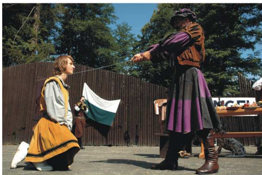
Rytíř právě pasuje své páže na panoše