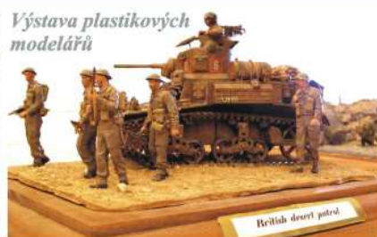
Výstava plastikových modelářů