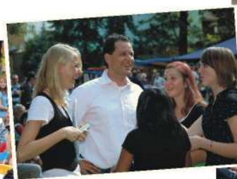
Starosta rakouského Freistadtu Ch. Jachs v obležení zpěvaček kapely Jazz Cats, jediného zahraničního hosta slavností.