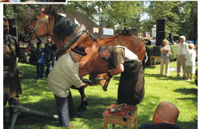
Formanská krčma a její jídelm bohatě obložené stoly zvou k hostině jak pány: rytíře, doprovázeného sokolníky, lovčím a pázetem, tak i chudý prostý, ale nadmíru veselý lid. V krčmě se nejen hoduje, ale i tančí a zpívá... Kovář na místě všem zvidavým předvádí, jak se ková kůň.