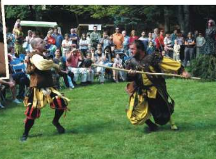
Rvačky a potyčky - nedílná součást každé pořádné formanské krčmy...