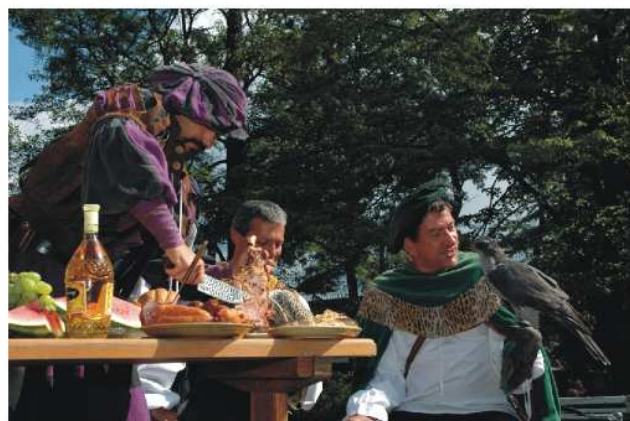
Pán z Pořešína se svými sokolníky