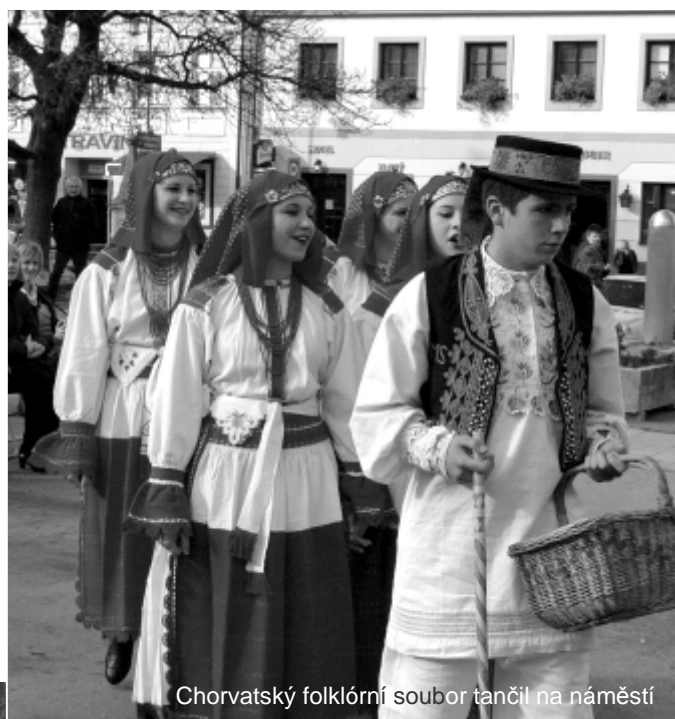
Chorvatský folklórní soubor tančil na náměstí