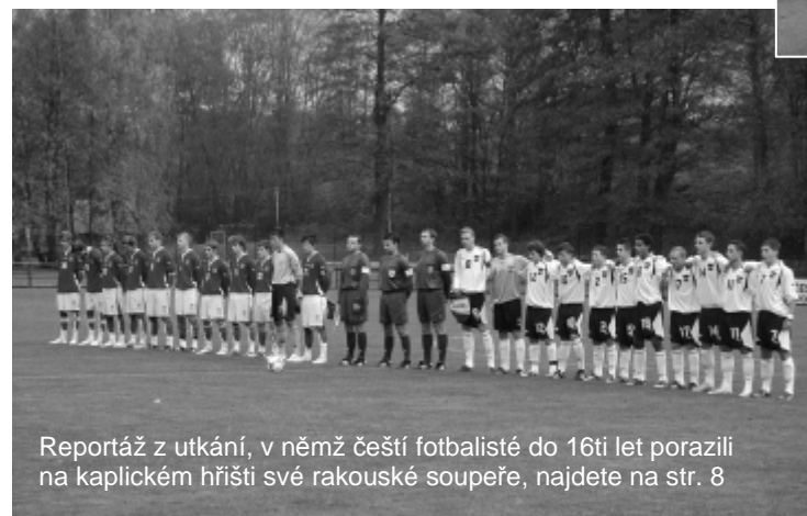
Reportáž z utkání, v němž čeští fotbalisté do 16ti let porazili na kaplickém hřišti své rakouské soupeře, najdete na str. 8