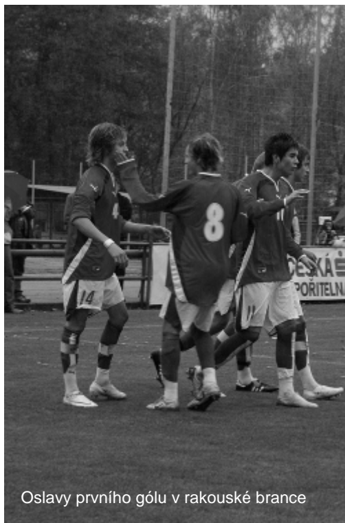
Oslavy prvního gólu v rakouské brance

hostujícímu brankáři značné problémy, ten však nakonec míč dokázal zkrotit ve svých rukavicích.