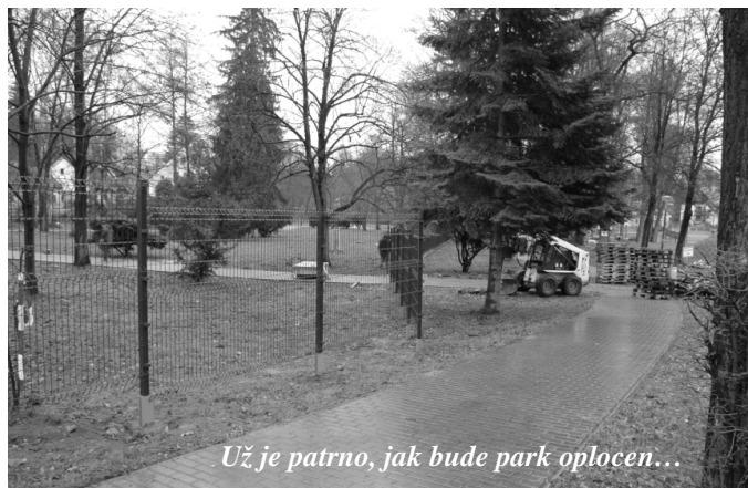
Už je patrné, jak bude park oplocen...

Kaplický Zpravodaj. Měsíčník. Vydalo Město Kaplice, Náměstí 70, 382 41 Kaplice, IČO 245941, tel. 380 303 100, nákladem 3000 výtisků. Evidenční číslo MK ČR E 115 76, uzávěrka 12. čísla 20. 11. 2008. Tisk Tiskárna FOP Černá v Pošumaví. Redakce KIC Kaplice, Linecká 434, 382 41 Kaplice, tel.: 380/311388, infocentrum@mestokaplice.cz . Odpovědný redaktor: M. Špičáková Bc., red. rada: J. Sejk, P. Odložil, J. Langová, V. Hajer, Z. Langová. Internetová verze: www.mestokaplice.cz