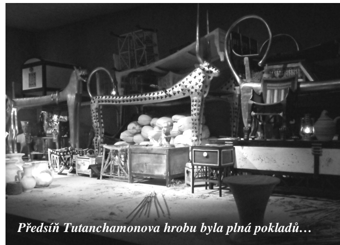
Předstín Tutanchamonova hrobu byla plná pokladů...