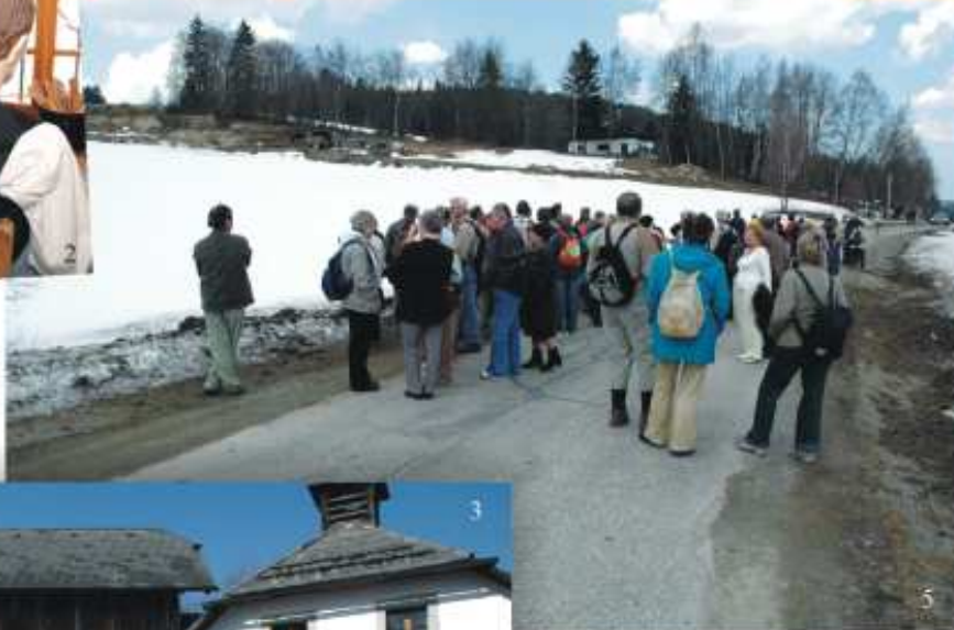
Řeka Malše o délce 96 km pramení ve Freiwaldu na úpatí hory Vichberg (1.112 m) poblíž Sandlu a tvoří 22 km dlouhou státní hranici mezi Rakouskem a ČR.