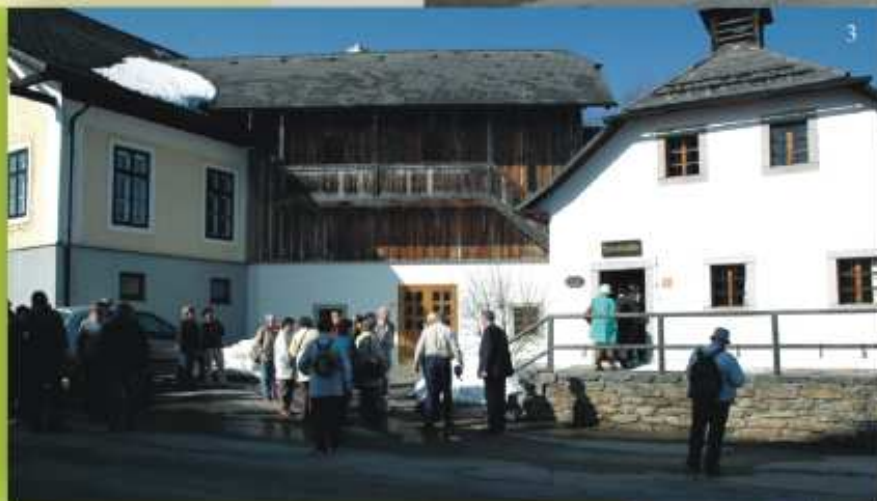
Součástí výletu byla návštěva Muzea malby pod sklo (1, 2, 3) a ukázky tradic jihočeských Velikonoc: pletení pomlázky, malování kraslic či výroba dekorativního symbolického kynutého pečiva "na živo" (obr. 4)