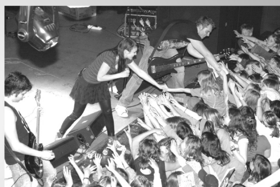
Ewa Farna... z koncertu 28. dubna v Kaplici