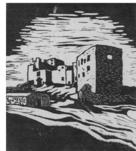
A. Mášová: Linoryt (Ráb)