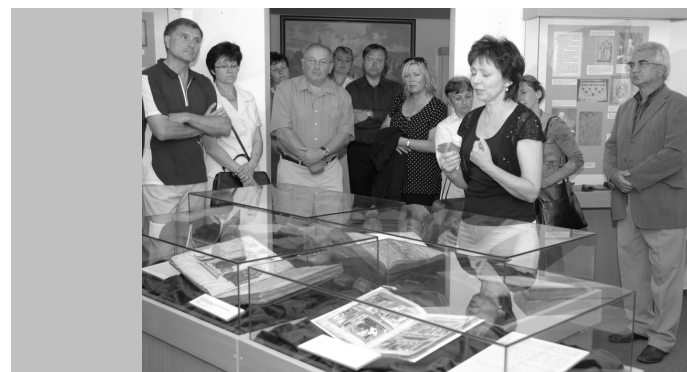
Výstava klementinských rukopisů v expozici potrvá do 20. 6.