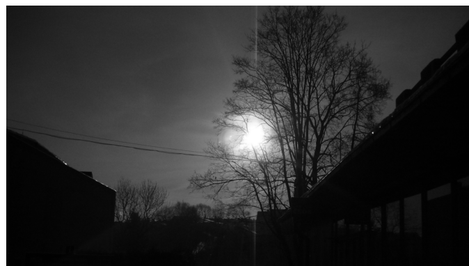
4. leden 2011, čas 9.22 dopoledne, terasa kina v Kaplici částečné zatmění slunce na jihovýchodní obloze