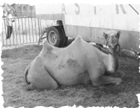
Velbloud z cirkusu Astra potěšil děti v Kaplici