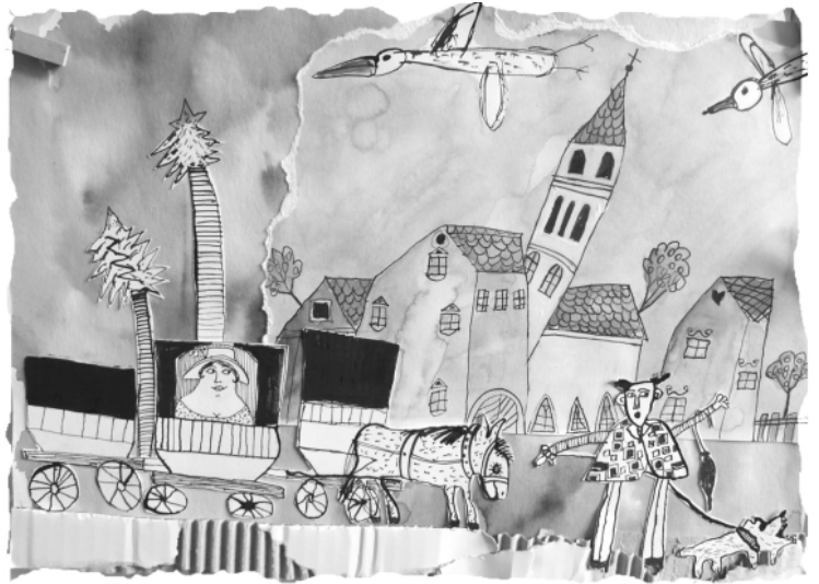
O výstavě “Cestování s koněspřežkou” a křtu nové knižky viz níže