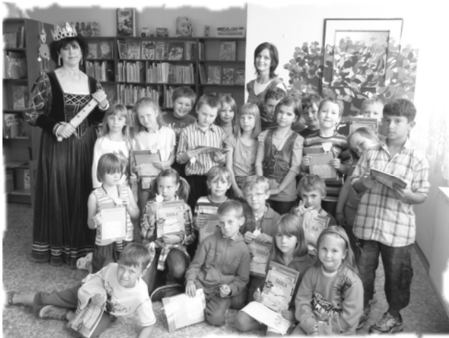
Počátkem června byli v městské knihovně “pasováni na rytíře krásného slova” prvňáčci kaplických základních škol. O akci se více dočtete na str. 7