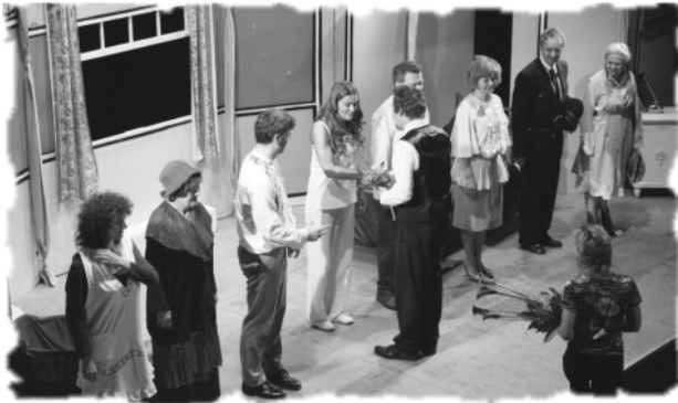
“Děkovačka” z představení Prolhaná Ketty, které do Kaplice přijeli sehrát herci pražské Divadelní společnosti Háta