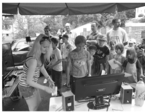
Dům dětí a mládeže Kaplice uspořádal 4. června v městském parku Den dětí