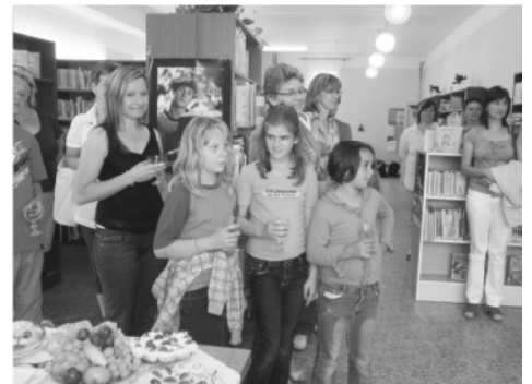
Mladí ilustrátoři knižky “Koněspřežka” při vernisáži výstavy a křtu v městské knihovně