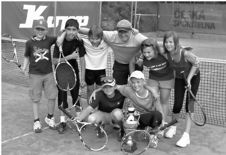
Na snímku smíšené družstvo mladšího žactva Sokol TK Kaplice s trenérem. Vítěz krajského přeboru v tenise.