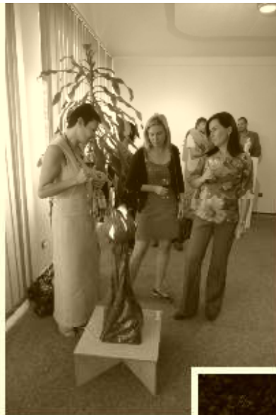
Na vernisáži. Jedna z vystavených uměleckých lamp