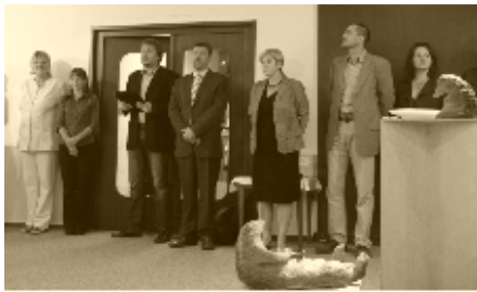
Vernisáž výstavy SUPŠ sv. Anežky České