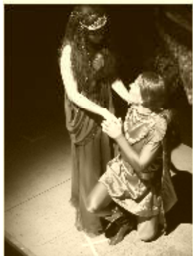
Na pohádce o princovi a Večernici v poctivém divadelním provedení s bohatou výpravou se 15. října přišlo podívat jen 55 diváků...