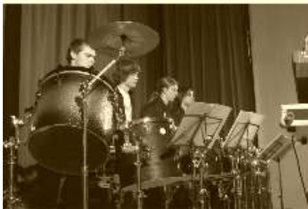
Výchovné koncerty pro školy tentokrát v podání bubeníků probíhaly v kinosále