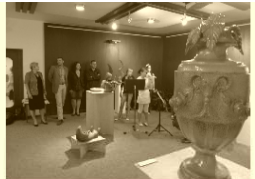
Výstavu keramických a sochařských prací studentů českokrumlovské střední uměleckoprůmyslové školy jste mohli v 1. polovině října navštívit ve výstavní sílni kulturního domu