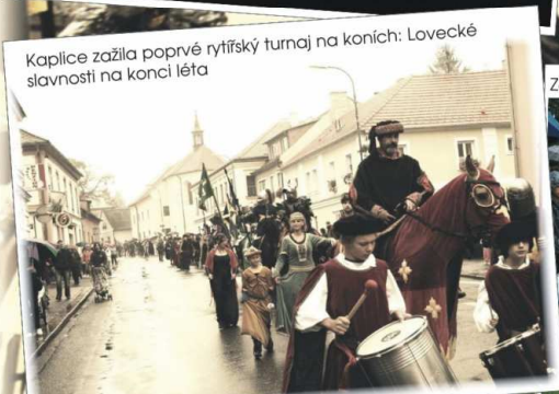
Kaplice zažila poprvé rytířský turnaj na koních: Lovecké slavnosti na konci léta