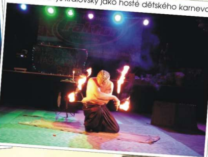
Fakír a hroznýš královský jako hosté dětského karnevalu