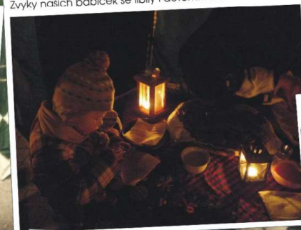
Zvyky našich babiček se libily i dětem: Adventní neděle