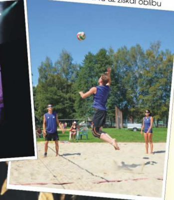
Plážový volejbal si tu už získal oblibu