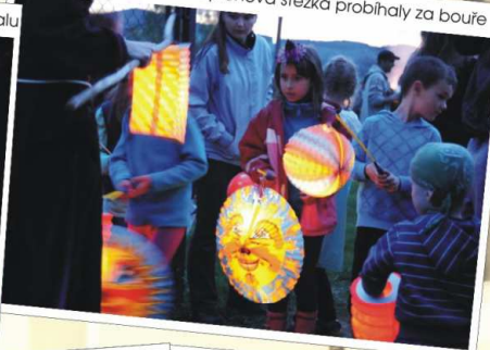
Pálení čarodějnic a lampionová stezka probíhaly za bouře