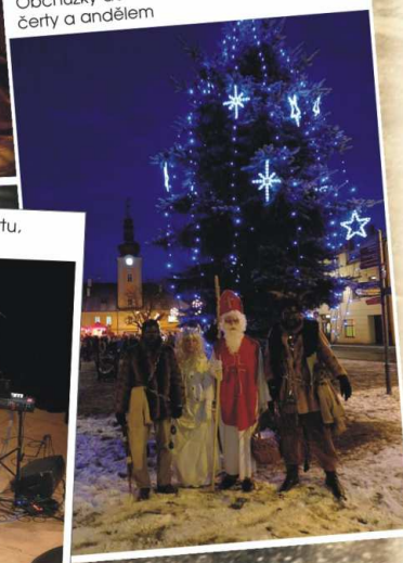
Obchůzky domácností s Mikulášem, čerty a andělem