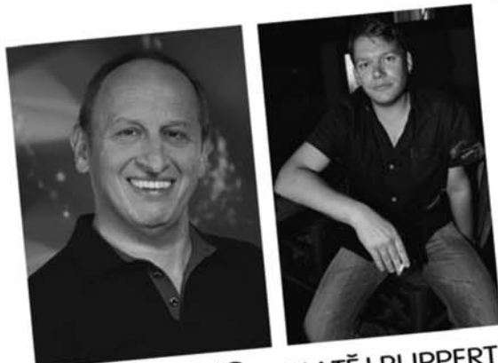
JAN KRAUS A MATĚJ RUPPERT

Talk show s JANEM KRAUSEM A MATĚJEM RUPPERTEM (Monkey Business)