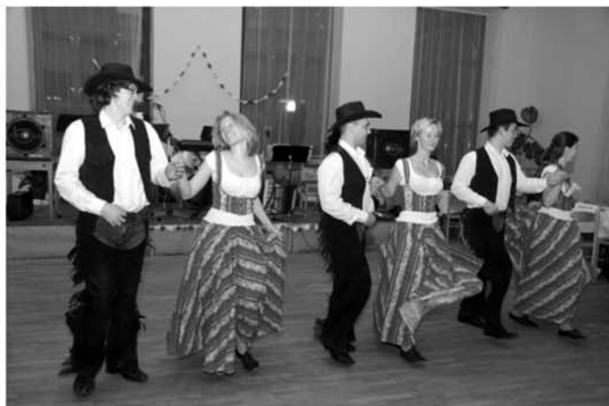
Předtančení – Křesťanský ples