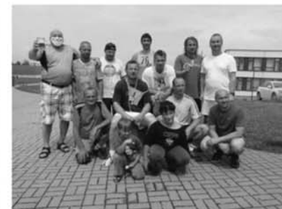
Společné foto soupis viz níže