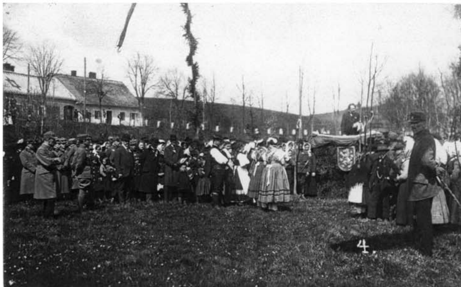
Na historickém snímku můžete vidět, jak vypadal městský park v roce 1919 (dnes na pozadí na mírném pahorku stojí panelové domy sídliště Na Vyhliďce)

Pronajmeme 33 m 2 nebytových prostor v centru Kaplice – ihned k dispozici. Tel. 602 956 651