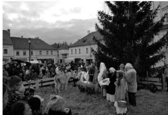
Advent začal v Kaplici rozsvícením vánočního stromu před radnicí, kde děti ze ZŠ Fantova zaranžovaly půvabný živý betlém.