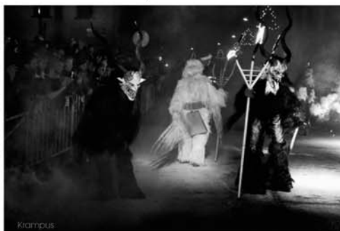
Večer 5. prosince jste ho mohli vidět na Čertím mejdanu na náměstí. Ale to pravé peklo přivezli do města až Krampusové 14.12.