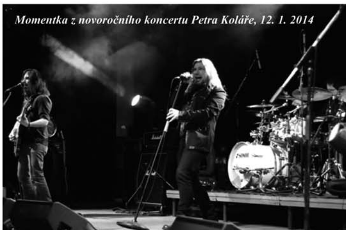
Momentka z novoročního koncertu Petra Koláře, 12. 1. 2014