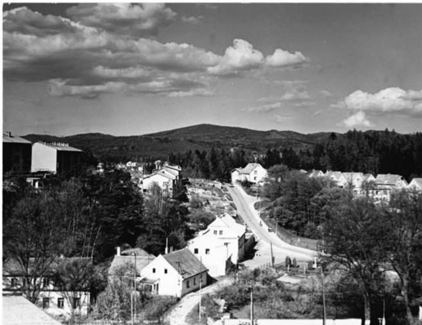
Historická hádanka. Na dobovém snímku z Kaplice je pohled na Malšské údolí a Slepíčí hory na pozadí. Odkud je ale tento záběr vyfotografován?