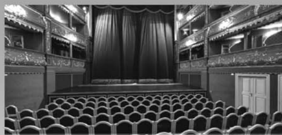
KIC Kaplice pořádá zájezd do jednoho z nejstarších a zároveň nejkrásnějších historických divadel Evropy