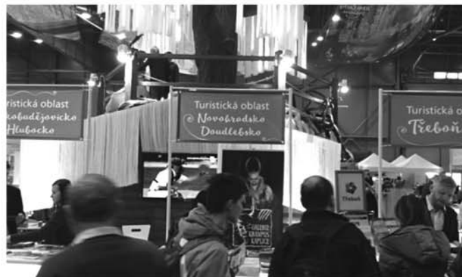
Ve dnech 19. – 22. 1. 2017 jsme za KIC Kaplice prezentovali turistickou nabídku Kaplicka v rámci výstavní expozice na Regioutour Brno.