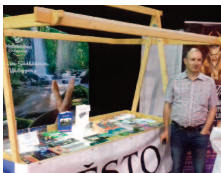
Stánek ve freistadtské výstavní hale Z procházky městem...