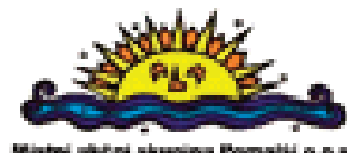
Místní akční skupina Pomalší o.p.s.