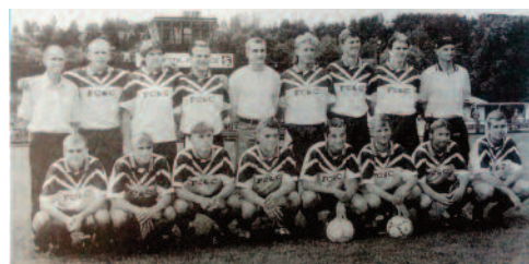
Vítěz krajského přeboru 1998/99 Spartak Kaplice před posledním utkáním sezóny doma se Sezimovým Ústím.

Podrobné informace o programu českokrumlovských soutěží se budou průběžně objevovat na oficiálních internetových stránkách: www.rallyekrumlov.cz a www.rallye-newenergies.cz .