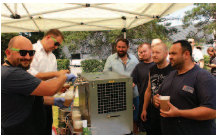
Nealkoholické pivo teklo proudem