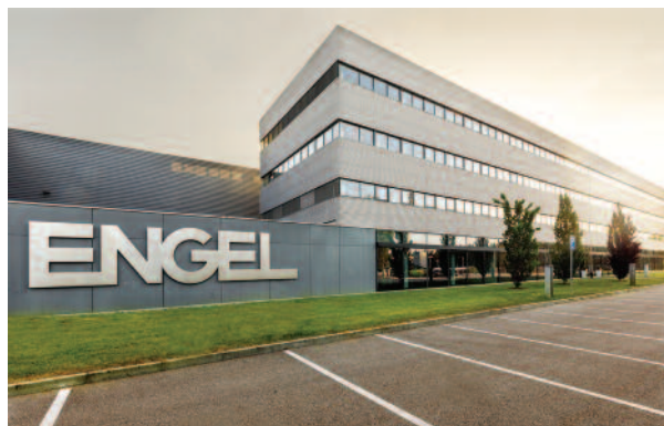
Administrativní budova společnosti ENGEL Kaplice