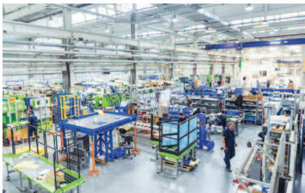
Hala oddělení elektro (EMO)

Letos ENGEL získal třetí místo v anketě Cena hejtmanky Jihočeského kraje za společenskou odpovědnost v kategorii firem s více než 250 zaměstnanci.