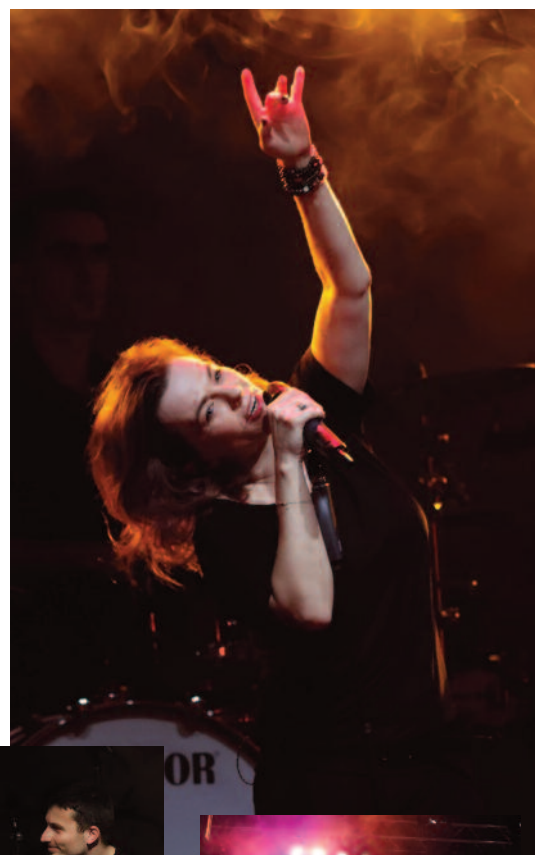
Novoroční koncert Marty Jandové v KD Kaplice