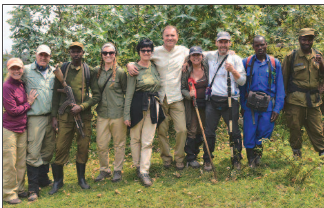
Naše skupina po úspěšném návratu z pralesa

Mám štěstí, neboť nám přidělená gorilí tlupa Suza, je sice nejvzdálenější, ale také nejpočetnější. Počáteční cesta džípem připomíná cestu kamenolomem, kde jednotlivé kameny vyčnívají i do půlmetrové výše. Pak následuje dvouhodinový pěší výstup obdělávanými poličky (díky místnímu klimatu je zde sklizeň brambor i třikrát do roka). A pak už v nadmořské výšce 2500 metrů dosahujeme hranici deštného pralesa, teplota se blíží 30 °C a podle průvodce se tlupa nachází asi ve výšce 3400 metrů. Několikahodinový výstup je opravdu strmý, v pralesě je vlhko a směs bláta, kořenů a lián klouže, takže se každou chvíli některý člen výpravy (mne nevyjímaje) octne na zemi.