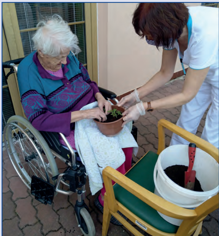
Výsadba letniček v DS Náměšť nad Oslavou, Kraj Vysočina

Nové informace o dětství, mládí, dospělosti i stáří člověka pomáhají pečujícím rychleji a lépe rozpoznat potřeby seniora. Na základě znalosti biografie připravujeme cílené aktivizační programy, při kterých podporujeme zachovalé schopnosti, dovednosti a celkovou orientaci klienta. Témata z biografie využíváme také k rozhovorům s klientem. Senioři mají možnost přirozenou cestou si obnovit nebo udržet slovní zásobu, trénovat paměť. Tím se zlepšila vzájemná komunikace, posílila důvěra mezi personálem a klientem, i rodinou.