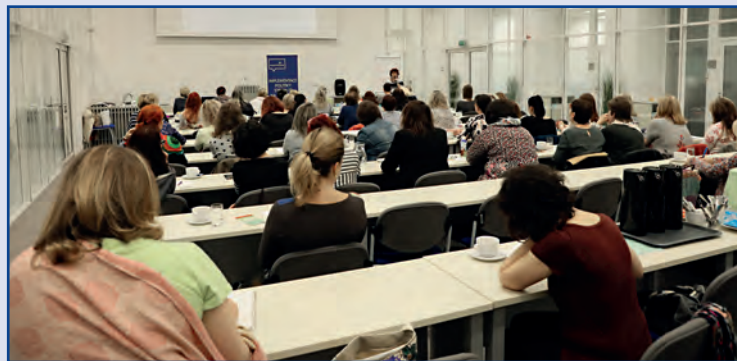
Kulatý stůl „Psychobiografické péče u seniorů“, Jihomoravský kraj

Závěr, který z psychobiografické péče vyplývá pro nás je jasný = být pro své blízké „čitelný“ . Vystihuje jej dobře poznámka, u které panovala shoda: „Nečekat na stáří, ale o svoji biografii se starat již dnes“ . Za podstatnou, považovali účastníci diskusi