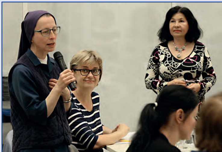
Diskuze o duchovní péči v psychobiografii, Jihomoravský kraj

spolku Klára pomáhá z. s. na Vysočině. Vypovídal o „ Praktických radách v domácí péči “.