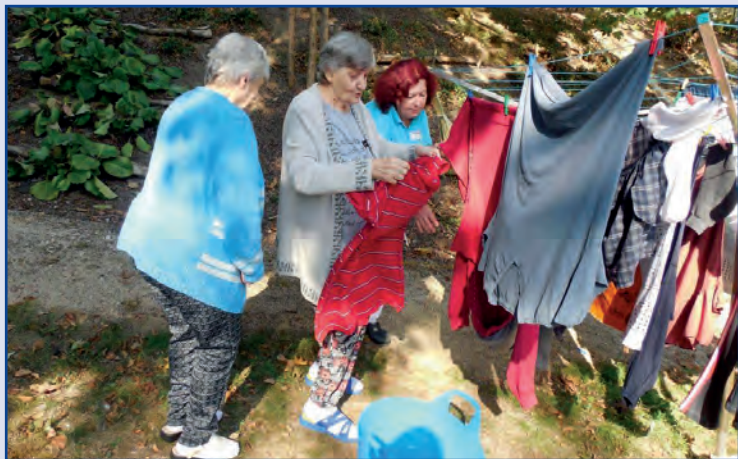
Střípky ze života, Vila Vitae, Liberecký kraj

život podle sebe. Právě kvůli omezené schopnosti vyjadřování a porozumění je pro pocit bezpečí a jistoty nutné vytvářet prostor pro projevení vlastní vůle a dávat možnost rozhodovat sám o sobě. Je to prostředí, ve kterém je samozřejmostí odmítat to, co nechci. Tak podporujeme projevení a nárůst kompetencí rozhodovat o sobě. Jsme přesvědčeni, že ani onemocnění demencí v pokročilém stadiu tuto kompetenci nevyklučuje.