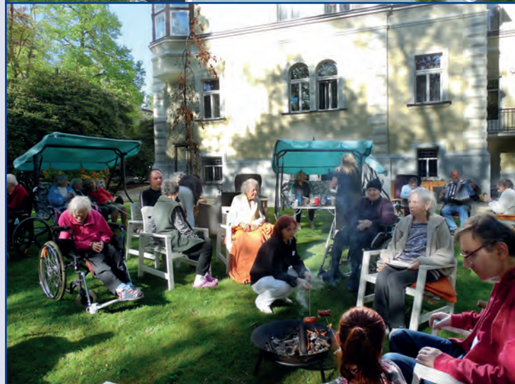
Střípky ze života, Vila Vitae, Liberecký kraj

Klientům poskytujeme pomoc, která ponechává každému jeho vlastní rozhodování v maličkostech každého dne, a tím podporujeme růst jejich vitality, chuť k životu. Věříme, že k rozhodnutí stačí poskytnout prostor k porozumění situaci. A právě Psychobiografický model péče učí, jak pomoci porozumět.