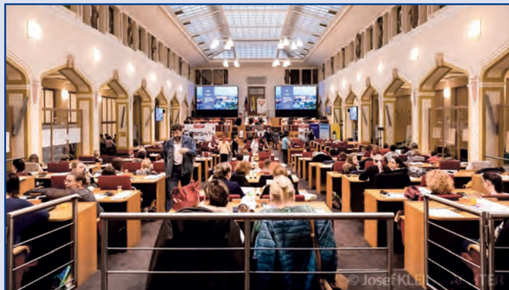
Mezinárodní odborná konference „Přínos biografie pro sociální práci“, Praha 2019 Záštitá MHMP a MPVS

během průběhu získávání informací od klientů (o jejich dětství, životních úspěších nebo strastech) a za vzájemné spolupráce s rodinami seniorů, se jim nejvíce změnil vzájemný vztah mezi klientem a pečovatелеm, často i s rodinou seniora. Najednou již zaměstnanci nevidí jen cizího, starého člověka, který potřebuje pomoc a péči, ale stojí před nimi někdo, kdo je vlastně jako jejich babička či dědeček, mnohokrát se stane, že mají podobné životní zkušenosti a zažili v životě hodně podobné zážitky. Často se dostávají do situace, kdy mají stejný smysl pro humor, anebo jsou starosti o jejich děti úplně stejné i přesto, že je dělí od sebe 50 i více let. Především vidí největší přínos inovace péče na základě biografie seniora v tom, že pečující se stará o seniora jako o osobnost a na základě etických zásad, které zvyšují důstojnost seniora, péče, ale i celého týmu. Jejich vize spočívá v tom, že se chtějí aktivně podílet na změnách při humanizaci péče o seniorskou generaci v České republice.