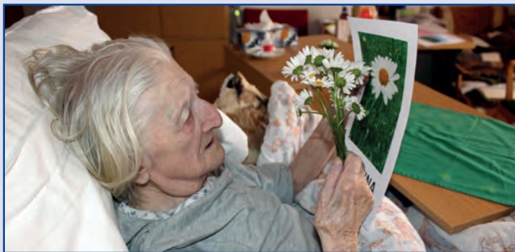
Smyslová aktivizace seniorů v DS Náměšť nad Oslavou, Kraj Vysočina

Nové informace o dětství, mládí, dospělosti i stáří člověka pomáhají pečujícím rychleji a lépe rozpoznat potřeby seniora. Na základě znalosti biografie připravujeme cílené aktivizační programy, při kterých podporujeme zachovalé schopnosti, dovednosti a celkovou orientaci klienta. Témata z biografie využíváme také k rozhovorům s klientem. Senioři mají možnost přirozenou cestou si obnovit nebo udržet slovní zásobu, trénovat paměť. Tím se zlepšila vzájemná komunikace, posílila důvěra mezi personálem a klientem, i rodinou.