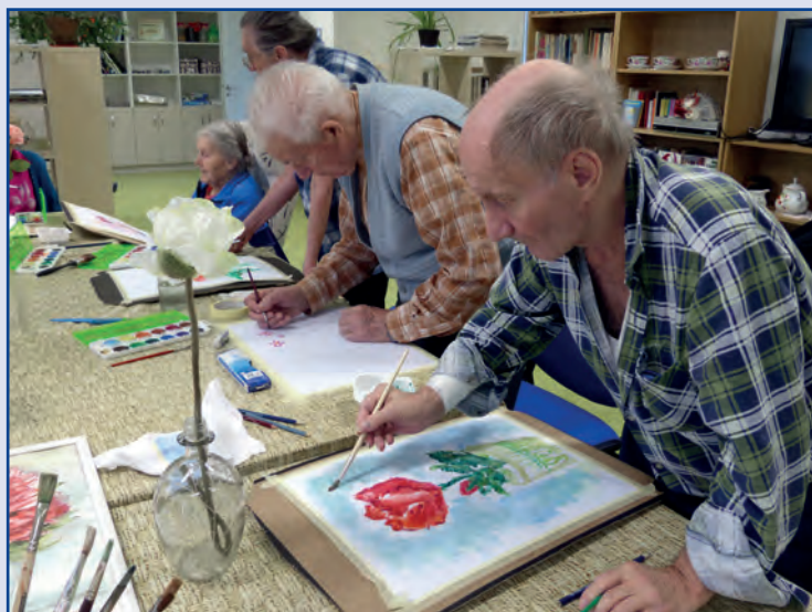
Aktivace v DS Bechyně, Jihočeský kraj

V Domově pro seniory Bechyně využíváme k péči o naše klienty Koncept biografické péče. Když jsme před 10 lety začínali pracovat s tímto modelem, byli jsme především nadšení. Nyní už víme, že bez takového či jemu podobnému modelu péče, založeném na biografii, není možné poskytovat moderní sociální službu, respektive péči. Znát životní příběh klienta je pro nás benefitem pro vztah a jakési vyjádření důvěry ze strany klienta, partnera. Z odborného hlediska nám biografie umožňuje pochopit chování, postoje a jednání našeho klienta. Pomáhá nám v nabídkové činnosti aktivit a aktivitací. Je pro nás daleko snadnější rozumět jeho potřebám, jeho zvykům a rituálům, které ve svém životě používáme všichni a možná si to vůbec neuvědomujeme až do okamžiku, kdy je nemůžeme z nějakého důvodu použít.