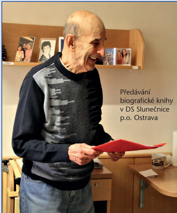
Předávání biografické knihy v DS Slunečnice p.o. Ostrava

S koncepcí biografické péče pracují v Domově Slunečnice Ostrava p. o. od roku 2014. Za pět let se jim podařilo postupně zpracovat 51 biografii klientů. Aby jejich práce měla smysl