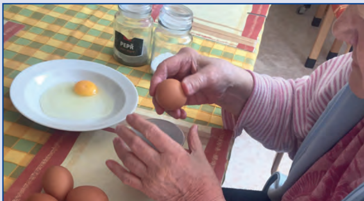
Aktivizace seniorů v DS Náměšť nad Oslavou, Kraj Vysočina