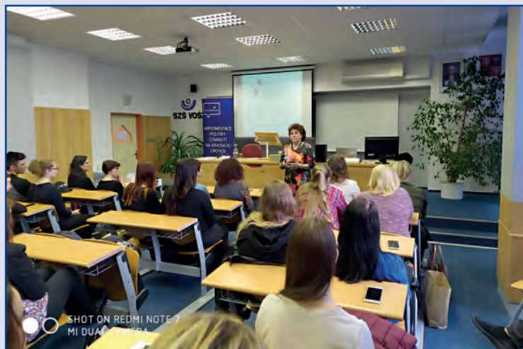
Kulatý stůl Péče o seniory s demencí na Střední zdravotnické škole a Vyšší odborné škole zdravotnické v Plzni